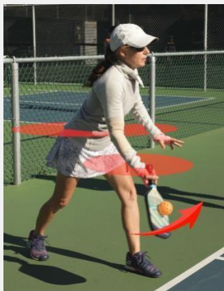
Figura 4-3 (servicio legal)