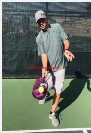
Figura 4-1 (servicio legal)