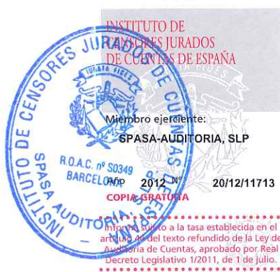
Fdo.:Roberto Pons Caballero Censor Jurado de Cuentas

Barcelona, a cinco de Julio de dos mil doce