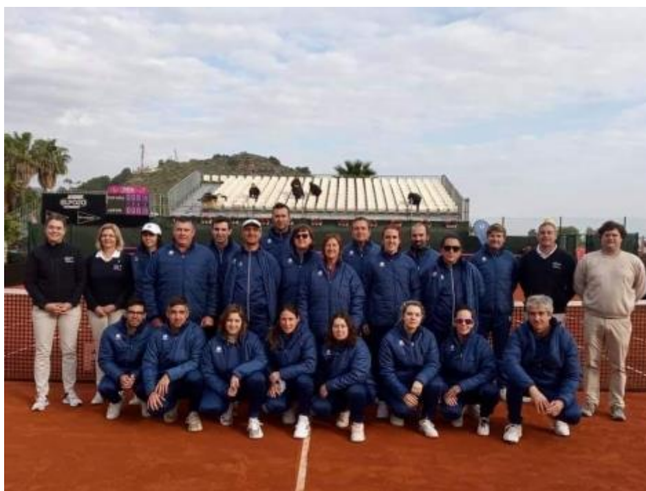
Equipo arbitral de la eliminatoria de Fed Cup España vs Japón en La Manga

“No puedes dejar que tus fallos te definan. Tienes que dejar que tus fallos te enseñen” (Barack Obama)